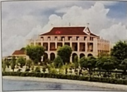
Bìa 1: Bến Nhà Rồng, nơi người thanh niên Nguyễn Tất Thành ra đi tìm đường cứu nước